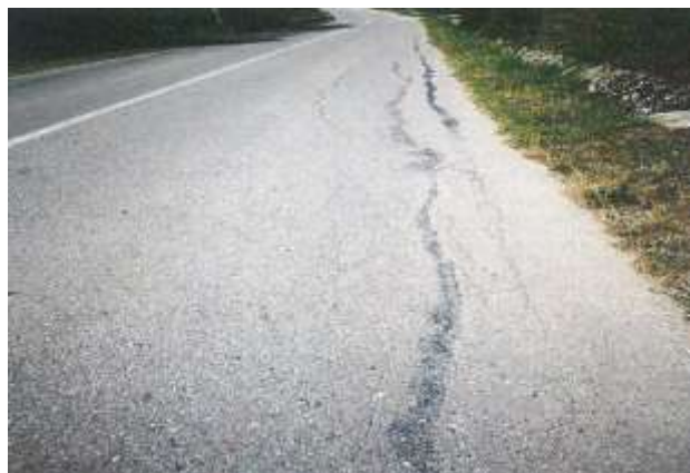
Situația existentă pe drumul județean 673A.

În consecință este necesară refacerea părții carosabile și infrastructura pe acest sector de drum, în zona între km 11+850 și km 12+450 unde capacitatea portantă este necorespunzătoare, în scopul aducerii drumurilor la parametri impuși de normele și normativele tehnice în vigoare